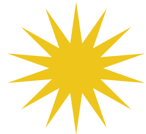
PERPADUAN 13 NEGERI & 1 WILAYAH PERSEKUTUAN